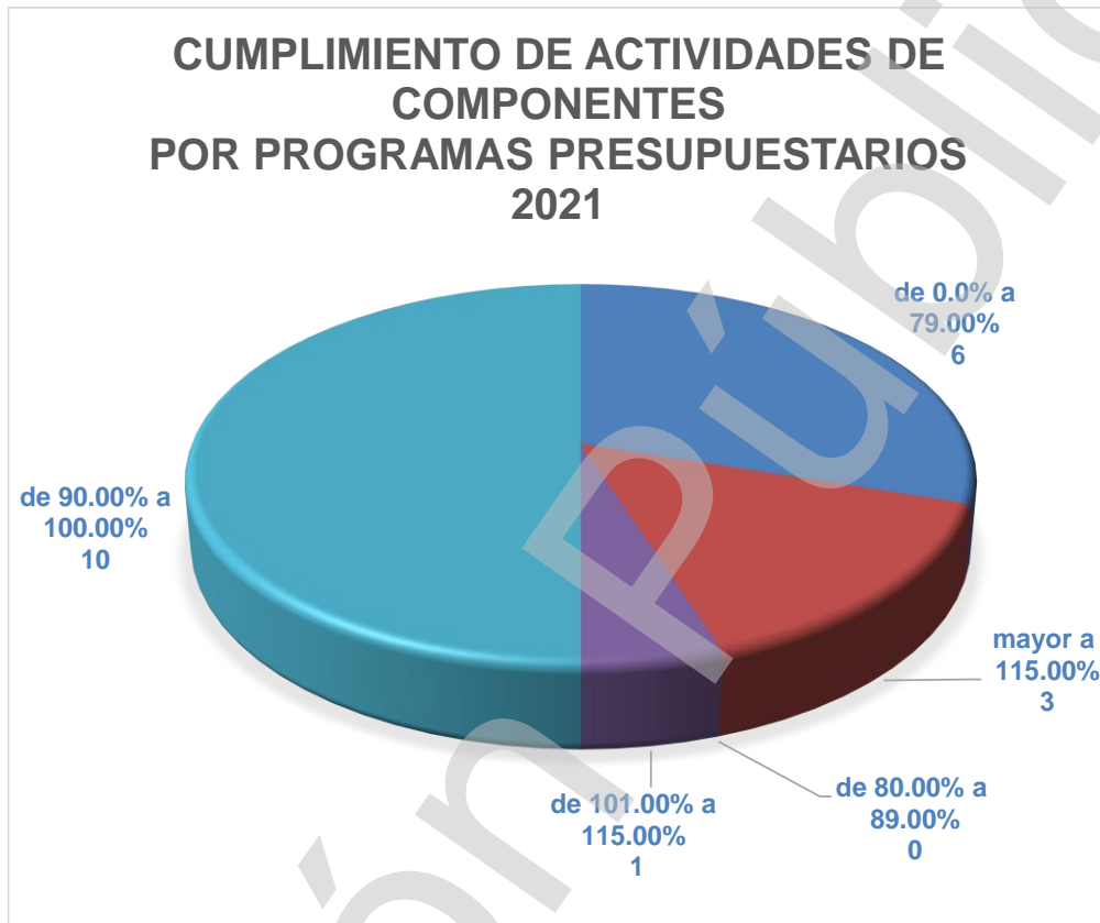
Gráfica 2 Cumplimiento de Actividades de Componentes Programas Presupuestarios 2021 (Porcentajes)